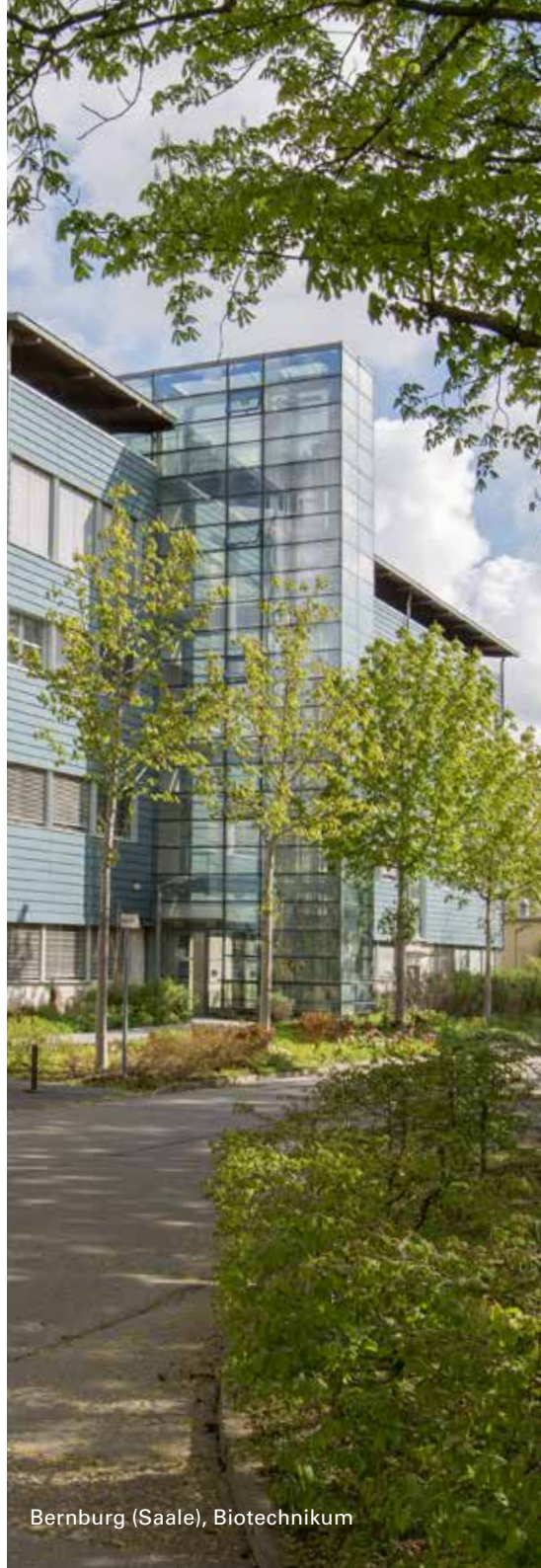
Bernburg (Saale), Biotechnikum

Neben dem Semesterbeitrag kann es studiengangspezifische Zusatzbeiträge (Gebühren) geben. Wenn diese Zusatzbeiträge für Sie anfallen sollten, überweisen Sie diese bitte zusammen mit dem Semesterbeitrag.