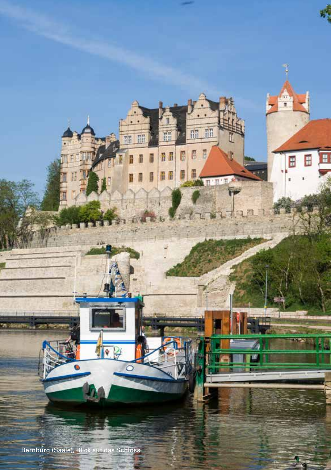
Bernburg (Saale), Blick auf das Schloss