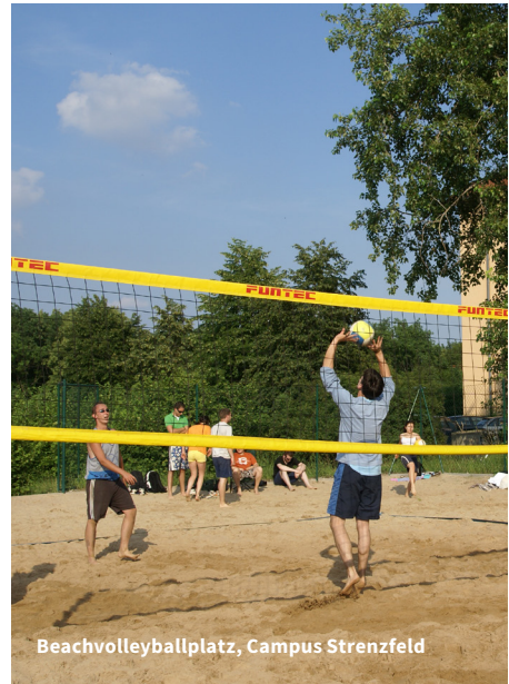
Beachvolleyballplatz, Campus Strenzfeld