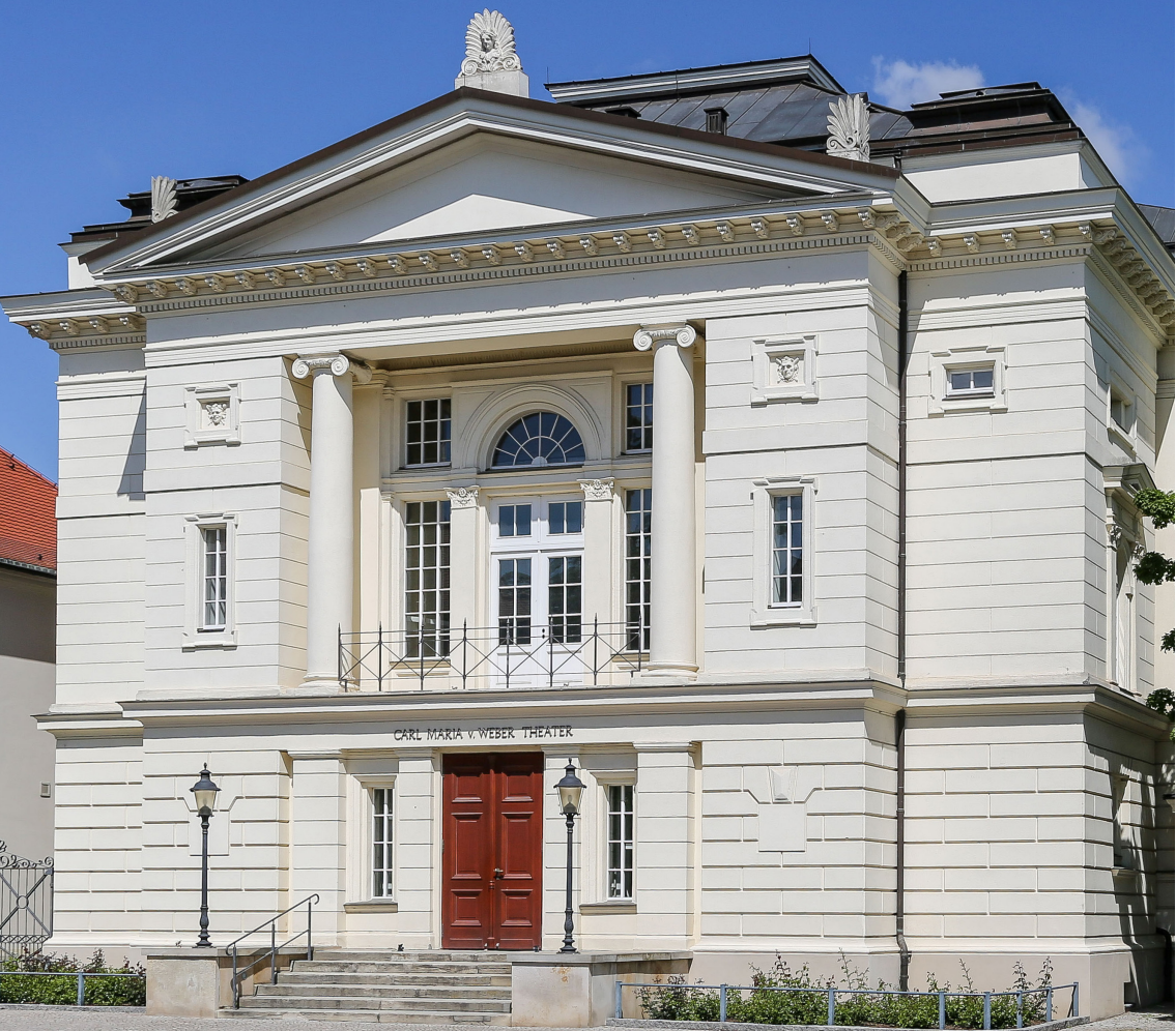
Bernburg (Saale), Theater