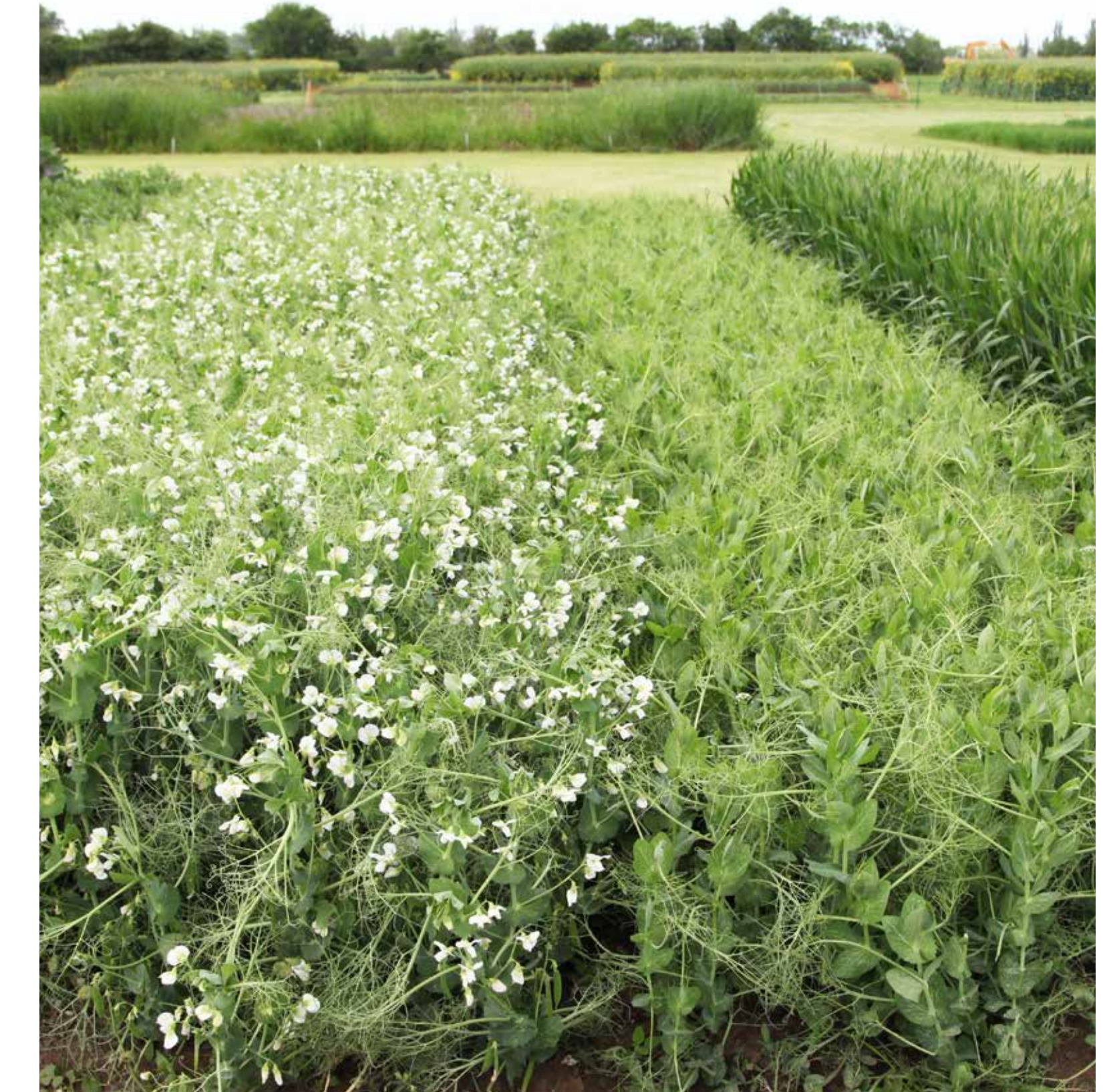
Vergleich Sommer- und Wintererbsen (Standort Bernburg)