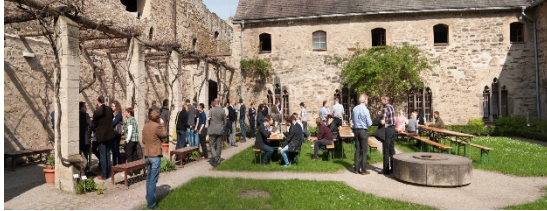
Bild: Ausblick in den Tagungsort im Jahr 2022