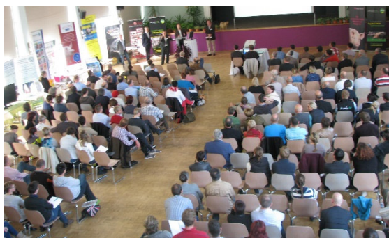
Bild: Ausblick in den Tagungsraum im Jahr 2022